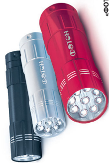
«ФОТОН» MS-0809-89 (5xLR03 в комплекте, 9 светодиодов), шоу-бокс Код для заказа 21442 Упаковка 12 / 144