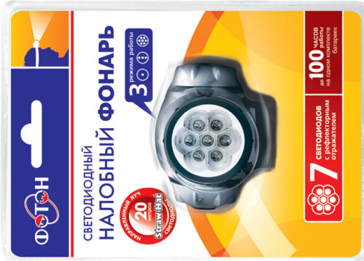
«ФОТОН» SH-0407-2 (5xR03) Silver (7 Straw-Hat светодиодов) Код для заказа 21104 Упаковка 1 / 10 / 100