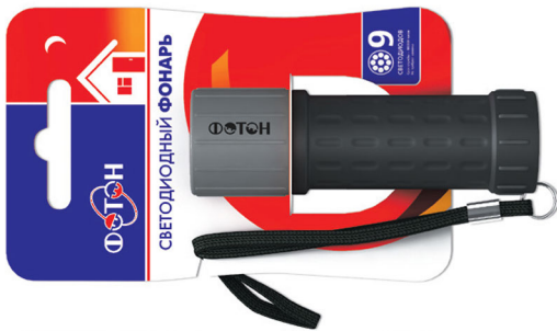
«ФОТОН» MR-0209 (3xR03) Grey Код для заказа 21178 Упаковка 1 / 12 / 72