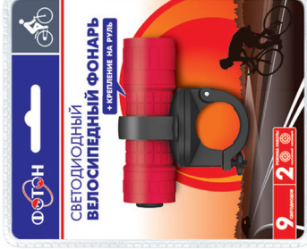
«ФОТОН» SC-0709-2 (3xR03) Road Red (9 светодиодов) Код для заказа 21259 Упаковка 1 / 16 / 96