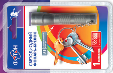
«ФОТОН» K-0601 (1xR03) Titan Код для заказа 21163 Упаковка 1 / 12 / 72