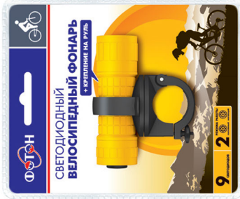
«ФОТОН» SC-0709-3 (3xR03) Mountain Yellow (9 светодиодов) Код для заказа 21260 Упаковка 1 / 16 / 96