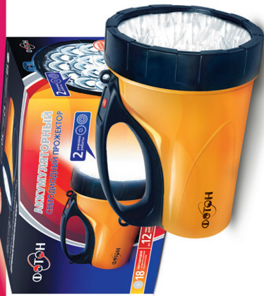
«ФОТОН» RB-0318 Yellow (18 светодиодов) Код для заказа 21126 Упаковка 1 / 6 / 36