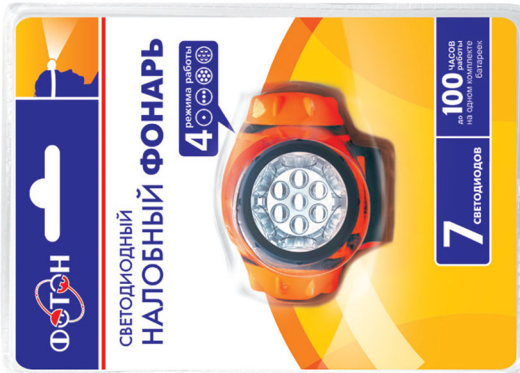
«ФОТОН» SH-0407-1 (3xR03) Yellow (7 светодиодов) Код для заказа 21103 Упаковка 1 / 10 / 100