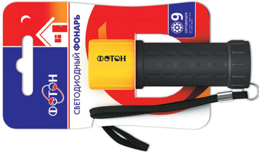
«ФОТОН» MR-0209 (3xR03) Yellow Код для заказа 21180 Упаковка 1 / 12 / 72