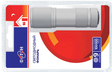
«ФОТОН» MS-0809 (3xR03) Silver (9 светодиодов) Код для заказа 21306 Упаковка 1 / 12 / 144