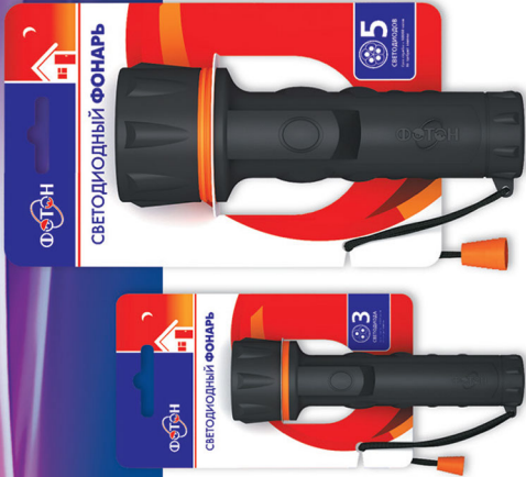
«ФОТОН» MM-0205 (2xR20) (5 светодиодов) Код для заказа 21165 Упаковка 1 / 6 / 60