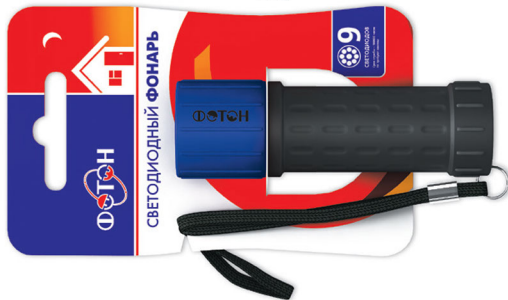
«ФОТОН» MR-0209 (3xR03) Blue Код для заказа 21179 Упаковка 1 / 12 / 72