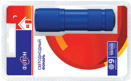
«ФОТОН» MS-0809 (3xR03) Blue (9 светодиодов) Код для заказа 21307 Упаковка 1 / 12 / 144