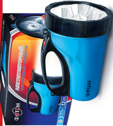
«ФОТОН» RB-0303 Blue (3*0,5W светодиода) Код для заказа 21125 Упаковка 1 / 6 / 36