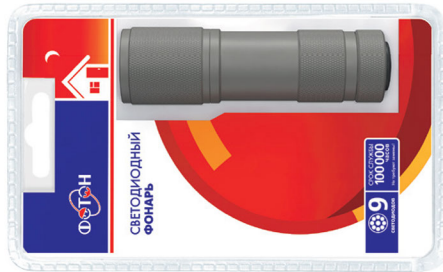
«ФОТОН» MS-0809 (3xR03) Gun Metal (9 светодиодов) Код для заказа 21307 Упаковка 1 / 12 / 144