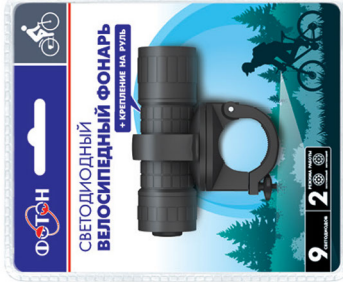
«ФОТОН» SC-0709-1 (3xR03) Forest Black (9 светодиодов) Код для заказа 21258 Упаковка 1 / 16 / 96