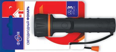
«ФОТОН» MM-0203 (2xR6) (3 светодиода) Код для заказа 21164 Упаковка 1 / 10 / 60